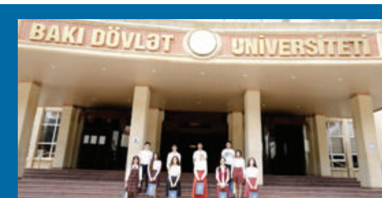
BDU-nun rektoru "Gənc istedadlar" liseyini medalla bitirən məzunlarla görüşüb